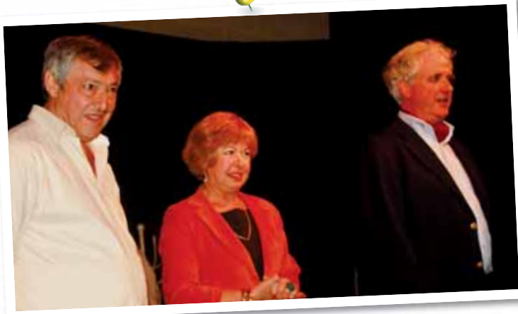
Théâtre «ART», succès mondial