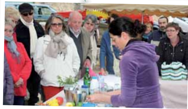
Fête de l'asperge