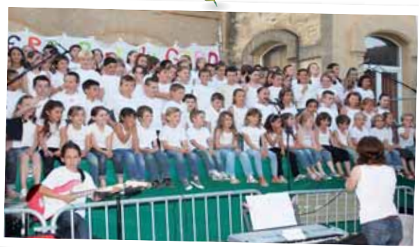
Fête des Ecoles