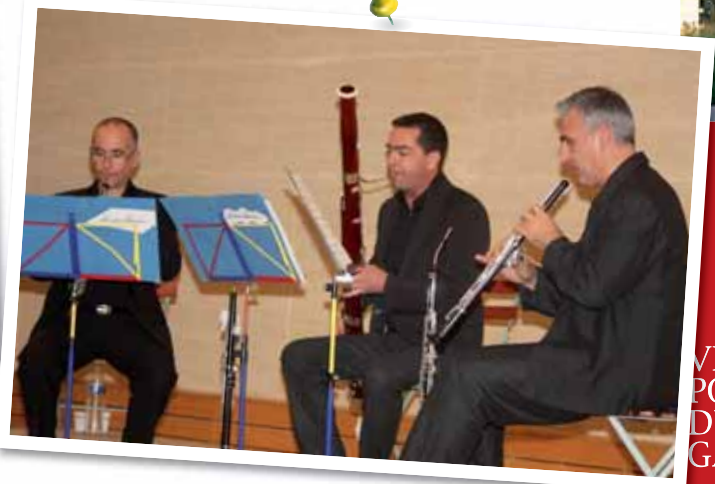
Concert Trio Besozzi