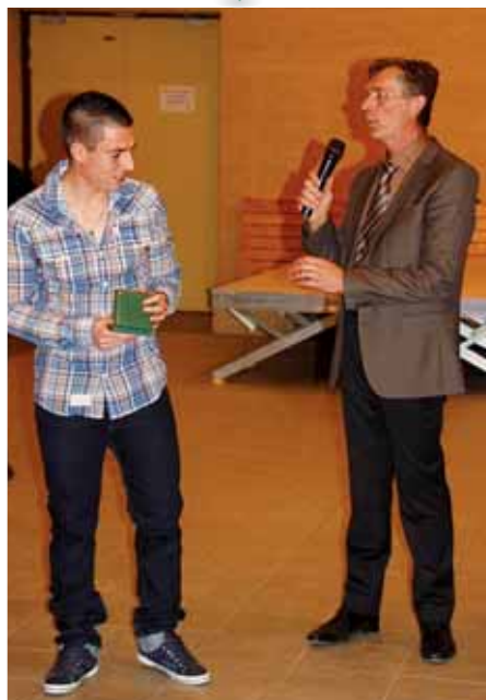
Les vœux du Maire