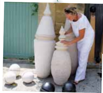
Cours et Jardins des Arts