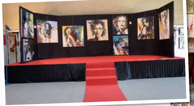
Exposition Académie des Beaux Arts de Vers-Pont du Gard