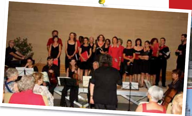
Chorale de Coline Serreau